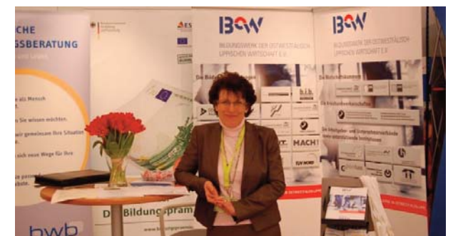
My Job OWL vom 26.- 28.02.2010 im Messezentrum Bad Salzuffen.