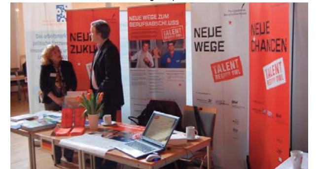
Resettlement & Employment Fair des Career Transition Partnership am 16.03.2010 im Stadtpark Schützenhof, Herford.