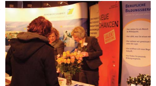
17. Weiterbildungs- und Informationsbörse für Frauen am 13.02.2010 in der VHS Bielefeld, Ravensberger Spinnerei.