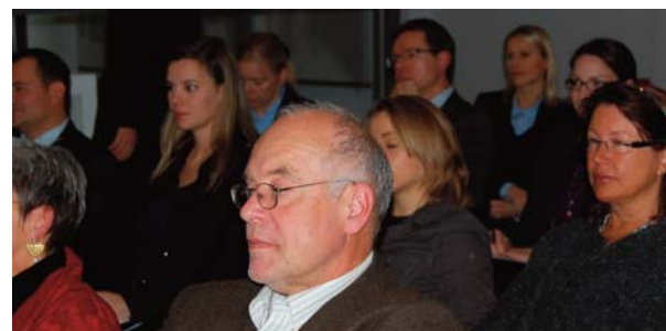
Jede/r Teilnehmer/in hat einen persönlichen Bezug zum Thema