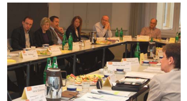
Im Arbeitskreis Weiterbildungsträger wurden am 17.11.2009 die Voraussetzungen zur Teilnahme an Externenprüfungen intensiv mit den zuständigen Stellen diskutiert.