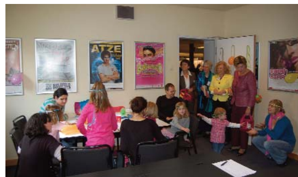
Die Kinderbetreuung während der Weiterbildungsbörse wurde von den Schülerinnen des Carl-Severing-Berufskollegs übernommen