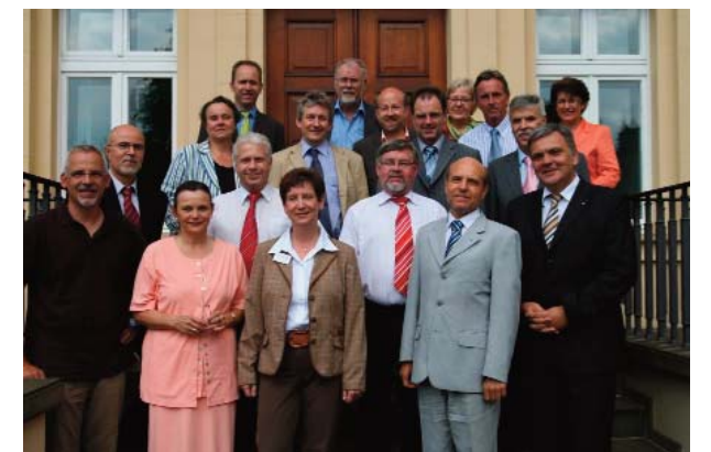
Im Lenkungskreis des Projektes Talentregion OWL sind alle relevanten arbeitsmarktpolitischen Akteure der Region vertreten: Agenturen für Arbeit Bielefeld und Detmold, Arbeitplus, GTaktiv, die Regionalagentur, die Tarifpartner Unternehmerverband und Gewerkschaft sowie die projektbeteiligten Institutionen.