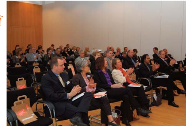
Fachtagung zum Thema Migration in der IHK Lippe

Alle wichtigen Erkenntnisse aus diesem Projekt werden auf der Seite www.talentregion-owl.de und www.perspektive-berufsabschluss.de dargestellt.