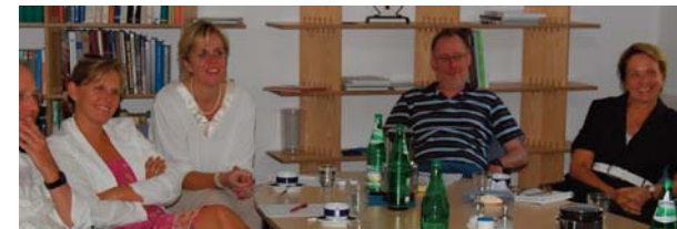
Treffen der Weiterbildungsberater/innen (Projekt „Weiterbildungstüren öffnen“) am 28.09.2009 (Foto oben) und am 24.08.2009