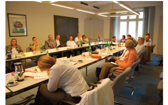
Die Weiterbildungsträger der Region zeigen sich an dem Projekt "Talentregion OWL" sehr interessiert.